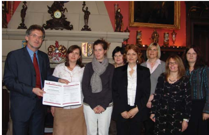
Übergabe der Zertifikate „Begabungspädagogische Fachkraft Stiftung Kleine Füchse “